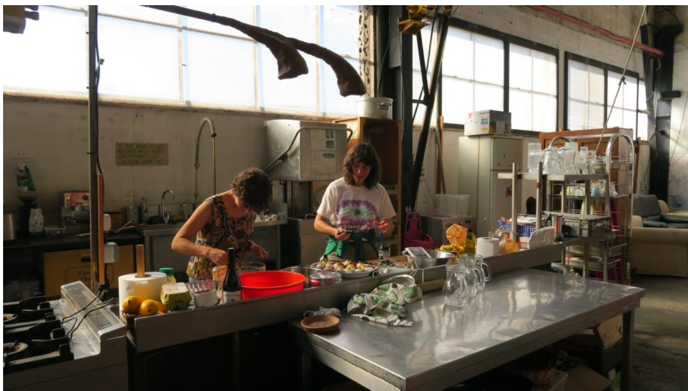
La cuisine des 8 Pillards est faite de matériaux et mobilier de récupération.