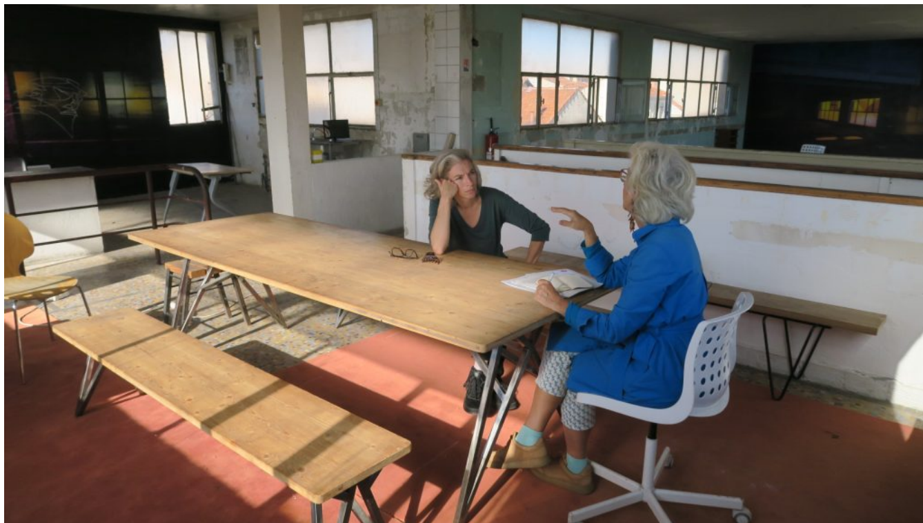
Quand l'usine était en activité, les ouvriers y entraient par cette tour.