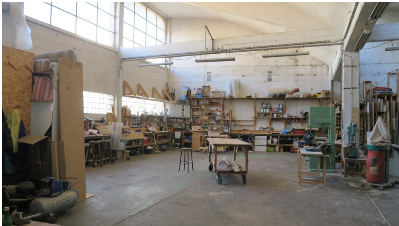
Quinze collectifs d'artistes ont leur atelier dans l'ancienne usine.